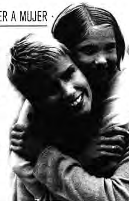
ACES | Digitalvision