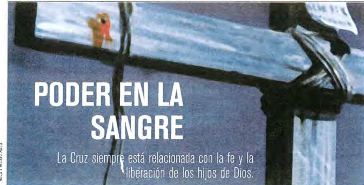
ACES | Archivo ACES

Aunque el anciano sensato incentivará a las personas a confiar en Dios, siempre hay quienes necesitan el brazo de un ser humano, aunque sea tan sólo por un momento. La persona que llegó al punto en que siente que debe revelar sus asuntos personales a otros humanos, ya está suficientemente abrumada; no añada su confianza es añadirle un sufrimiento adicional. Mantenga ese secreto entre usted y ella, y así estará usted estableciendo lazos de confianza que le permitirán ayudarla. El momento que sabe callarse tiene un buen mesurable.