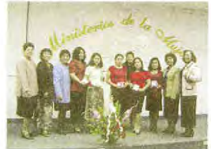
Carta agradecimiento - Becas de estudio

"Caravana del Poder" - se llamó la semana de cosecha en la Misión del Lago Titicaca, que tuvo como orador al Pastor Alejandro Bullón. Fue un gran acontecimiento y las mujeres desempeñaron un papel muy importante. En cada comunidad dieron seminarios sobre abuso y violencia, organizaron programas de oración y ayuno y durante las reuniones desarrollaron el ministerio de Oración intercesora, distribuyéndose entre las personas. Las esposas de los pastores también participaron ayudando a preparar el alimento para el equipo de más de 70 personas, en lugares que están a más de 4.200 metros de altura. Los resultados fueron maravillosos, 10.534 personas bautizadas, gracias a Dios por las mujeres involucradas en el Ministerio de evangelismo.